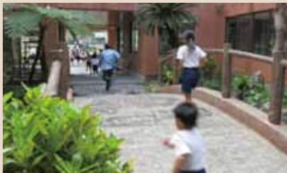
津波からの避難訓練 (奄美市立大川小中学校)

全国の教員を派遣し、地域の行事での講演や小学校での出前講義などを行っています。 例えば、鹿児島県教育委員会「防災教育モデル実践事業」(文部科学省「実践的防災教育総合