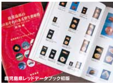
鹿児島県レッドデータブック初版