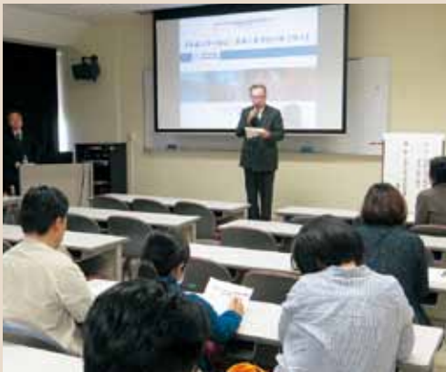
緊急被ばく医療講演会

私たちは、放射線災害関連の活動に取り組んでいます。福島原発の事故の後、文部科学省の専門的看護師・薬剤師等医療人材養成事業（GP）に採択され、2012年度から放射線看護専門的看護師養成教育課程を設置し、放射線の看護について専門的に学ぶ看護師の養成を行っています。放射線医学や被ばくと防護、看護に関して学んだ大学院修了生が、看護職の人たちに知識や技術を教育指導するわけです。これまでの修了生は、大学病院、環境省本府庁に勤務するほか福島で住