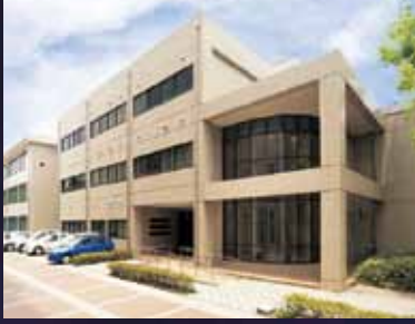
鹿児島大学地域防災教育研究センター (鹿児島大学産学官連携推進センター棟内)