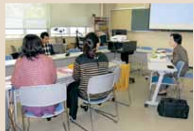
長崎大学との合同講義

を結び共に学んでいます。また、長崎大学と福島県立医科大学が共同大学院を新設する予定です。これが進めば、放射線看護について専門的教育を実施する学校が全国で4校になります。次年度には、専門看護分野の一つとして認められる見通しです。