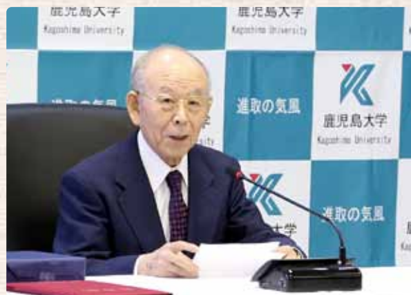
↑ 挨拶を行う赤崎終身教授