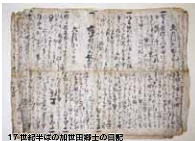
17世紀半ばの加世田郷士の日記