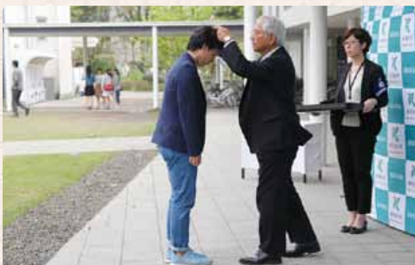
↑パスを授与される学生

選挙コンシェルジュの14人は、学内外で啓発映像の放映やチラシの配布などにより選挙前日まで投票を呼び掛けました。