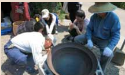
地元住民に「火起こし」を学ぶ (霧島市国分毛梨野)

豪雨・山地崩壊などによる災害の解説や警戒避難対応への助言を行い、かつ地域住民向けのシンポジウムを開催しました。このような活動を通じて、モデル校の児童・生徒や教職員の