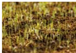
発芽したばかりのアフリカイネ

作物の生産、販売まで手がけて学問を社会に生かしたい！ 熱い思いを行動に変え、チャレンジし続ける“情熱小僧集団”。