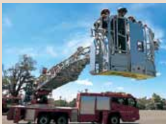
はしご車に乗る (霧島市消防局協力)

野山でよく遊び、火を巧みに操る「地域の高齢者」の力を借りて、学生は薪火での鉄釜煎りや炭火での竹ざる蒸しなどの伝統的な工程を体験しました。最近の学生の多くはマッチの摺り方もあやふやで、火の扱いに慣れていません。災害での停電時にはロウソクに灯りを点