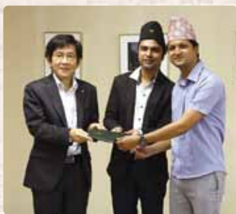
↑住吉理事から目録を受け取る、アリアルさんとボハラさん