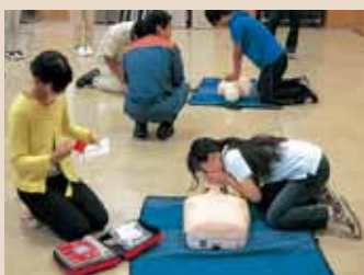
救急救命講習 (鹿児島市消防局協力)

けたり、ご飯を炊いたりする場合もあり、野外活動を楽しみながらさまざまな経験を重ねてもらって、万が一の有事に生きぬく力をつけてもらいたいです。