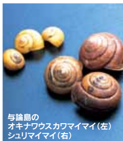
与論島の オキナワウスカワマイマイ(左) シュリマイマイ(右)