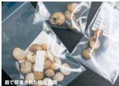
島で採集された陸産貝類